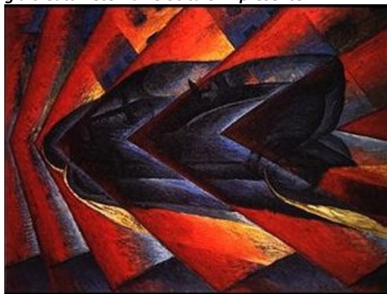
Luigi Russolo – "dinamismo di un'automobile" 1912

Filippo Tommaso Marinetti (Manifesto del Futurismo 1909)